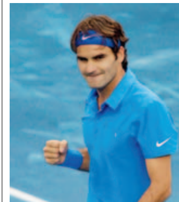
Roger Federer redevient numéro deux mondial.

Roger Federer a cependant trouvé les ressources pour inverser le cours du match. Après avoir mené 5-2, il a dû attendre le douzième jeu du 2 e set, pour égaliser à une manche partout. Bien que chahuté dans le set final, le Suisse réalisait le break décisif sur sa quatrième balle de match à 6-5. ◉ FLOS